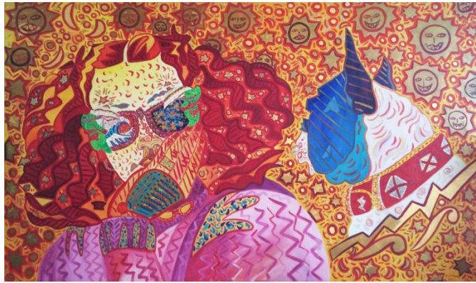
La belle excentrique – Huile sur toile et feuilles d'or 3m20 x 1m80