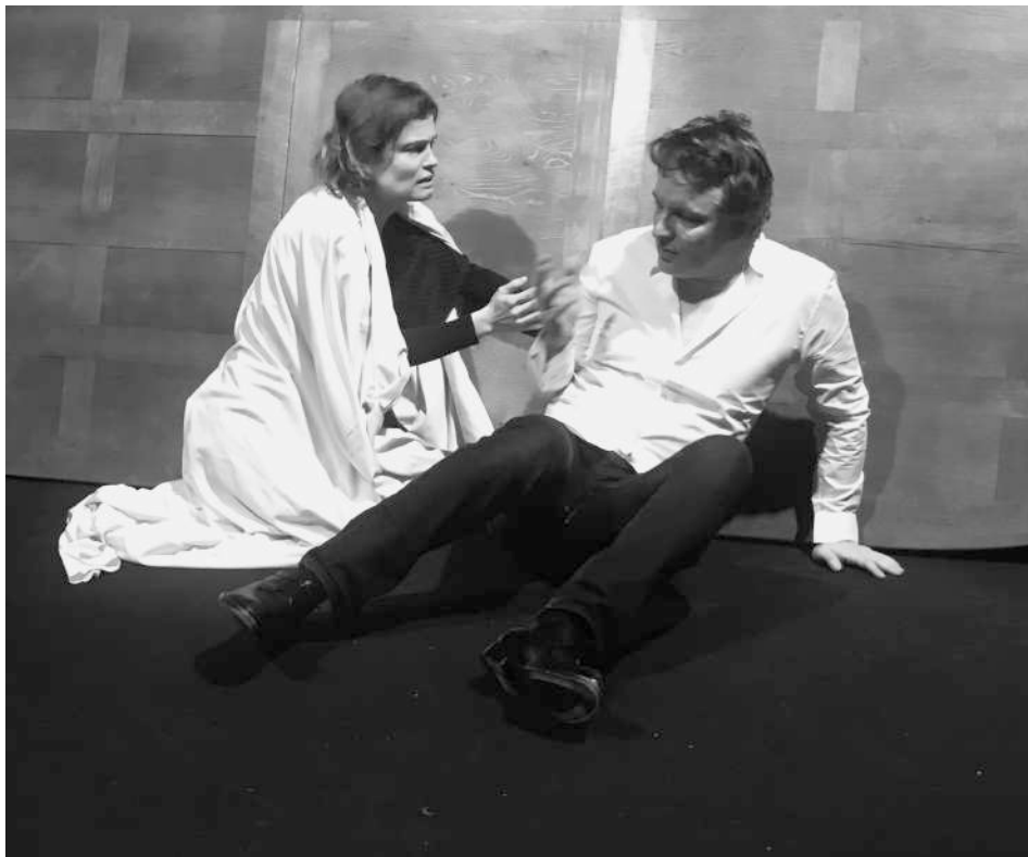
photographie de répétition – Christophe Lidon

Elle fait ainsi résonner plus précisément le passé familial de Julie qui est au cœur de sa quête d'identité.