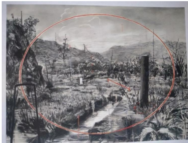
Colonial Landscape, William Kentridge

Tenant à distance ces violences, la scène est comme un refuge pour ces existences évanescentes. Un autre monde s'y développe qui se conjugue au féminin.