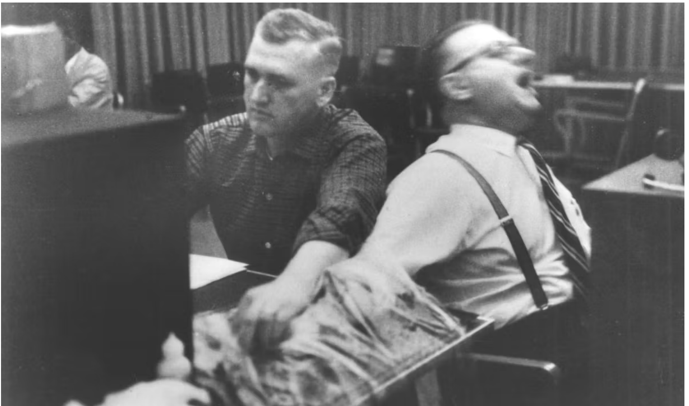
Expérience sur l'obéissance et la désobéissance à l'autorité - Stanley Milgram- 1963

Entre quais portuaires en grève et plateaux télé, le spectacle enquête sur ces moments de bascule. 1951, l'affaire Henri Martin, des dockers refusent de participer à la guerre d'Indochine. 1962, à l'université de Yale, Connecticut, le professeur Milgram dissèque notre capacité à obéir. 2009, en plein durcissement sécuritaire et triomphe du pouvoir médiatique, cette même expérience ressurgit sous forme de jeu télé — tandis qu'un groupe de jeunes s'interroge sur l'héritage de ces histoires qui les précèdent.