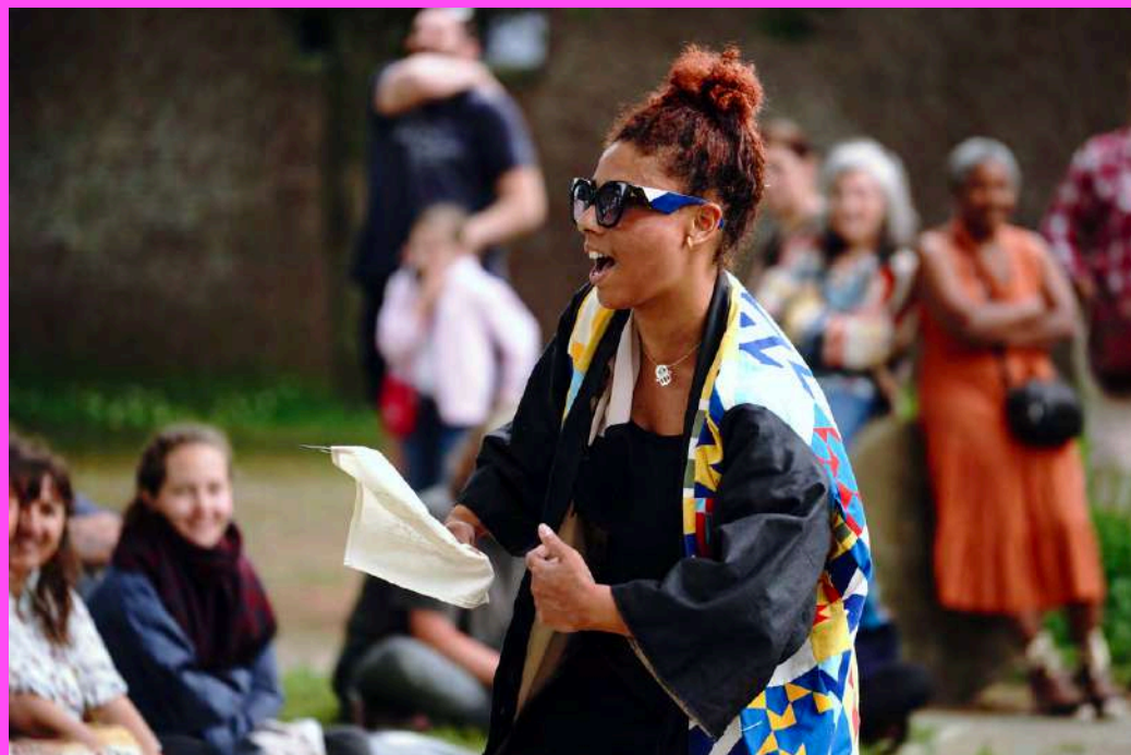
La Colombe enragée - Le Prénom ©Manu Picado