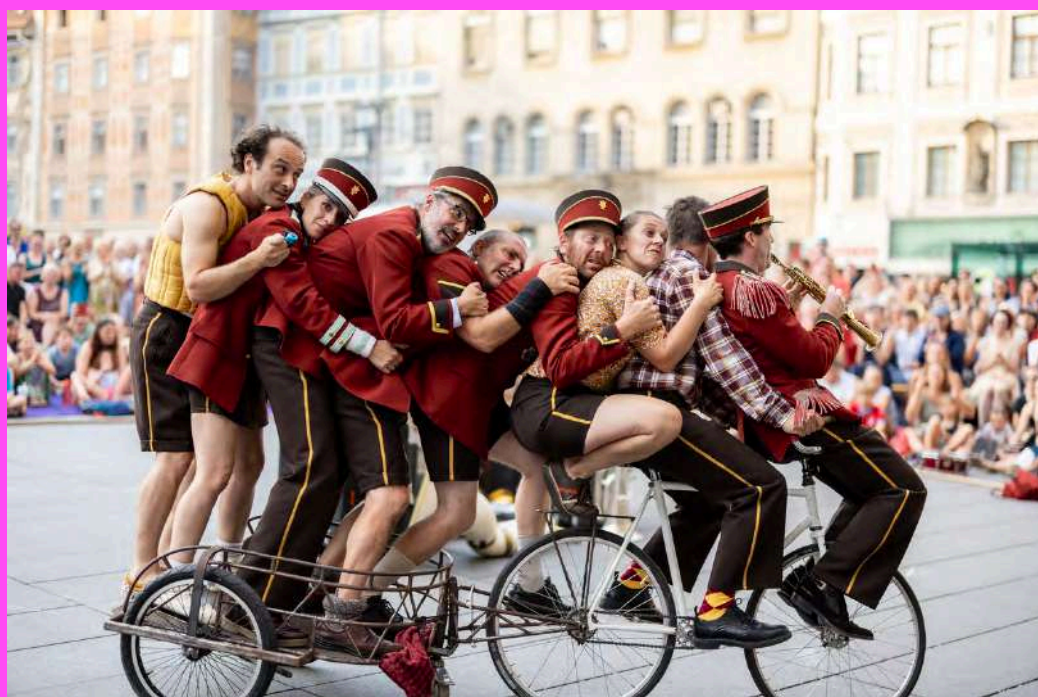
Cheptel Aleikoum - OctOpus