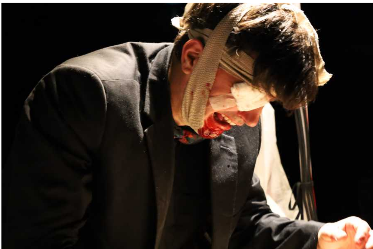
La Demande en mariage - Pôle Sud - Chartres de Bretagne - Octobre 2024

Le Commun des Mortels monte ses spectacles en diptyques: une petite forme autonome décentralisable couplée avec un spectacle plus sédentaire. La petite forme associée au REVIZOR est La Demande en Mariage d'Anton Tchekhov, farce gore et réflexion sur la violence d'une société civilisée, créée en octobre 2024.